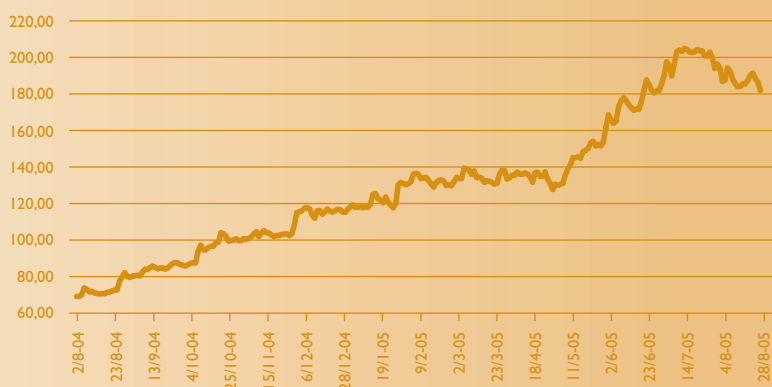
Auriga Industries A/S, kursudvikling august 2004 – august 2005.

Aurigas aktionærer har det sidste års tid kunnet glæde sig over en usædvanlig stor kursstigning på Auriga-aktien. Efter et par år, hvor kursen har ligget omkring 50-70, startede stigningen i august sidste år. Siden er det gået stærkt, og kursen er det seneste år mere end fordoblet. Efter i en periode midt på sommeren at have været handlet til over kurs 200 synes Auriga-aktien de senere uger at have stabiliseret sig på et niveau omkring kurs 180. Offentliggørelsen af halvårsresultatet den 22. august har ikke ændret ved situationen.